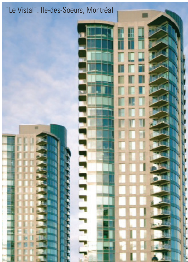
"Le Vistal": Ile-des-Soeurs, Montréal

L'intercalaire TGI-Spacer est un système d'intercalaire hybride unique qui allie les bienfaits de polymères à hautes performances à la faible conductivité de l'acier inoxydable, réduisant ainsi la transmission de chaleur à un niveau minimum tout en vous procurant une protection maximale contre les fuites de gaz Argon et la pénétration d'humidité. Les fenêtres à rendement thermique d'aujourd'hui et de demain constituent un élément crucial dans la gestion énergétique. Le TGI-Spacer satisfait et surpasse les attentes les plus sévères de l'industrie et ce, dans tous types de climats.